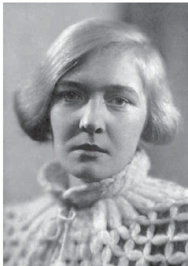
О.Ф.Берггольц. Довоенный снимок

О блокаде Ленинграда написаны сотни книг, авторами которых были писатели, поэты, журналисты, историки. Но когда мы перечисляем их имена, имя О.Ф.Берггольц стоит всегда в первом ряду. В том, что город на Неве выстоял и не сдался врагу, есть и её немалая заслуга. В начале 1942 года голодный и замерзающий Ленинград, проживший зиму без хлеба и газет, наконец услышал долгожданный человеческий голос в чёрных тарелках-динамиках. Это был голос Ольги Берггольц. «Голос, полный неподдельной любви и сострадания, голос, опалённый ненавистью к врагу, голос, взывающий к жизни и борьбе», — писал о нём Фёдор Абрамов, который впервые услышал его в нетопленном госпитале, размещённом в одной из университетских