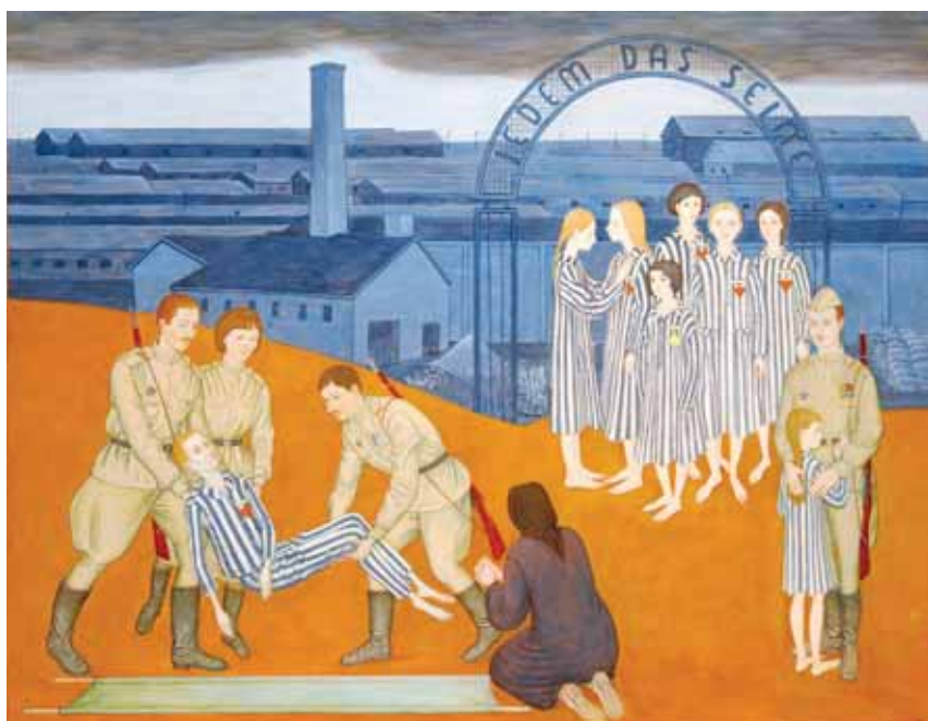
Освобождение узников концлагеря. 2005. Дерево, левкас, темпера