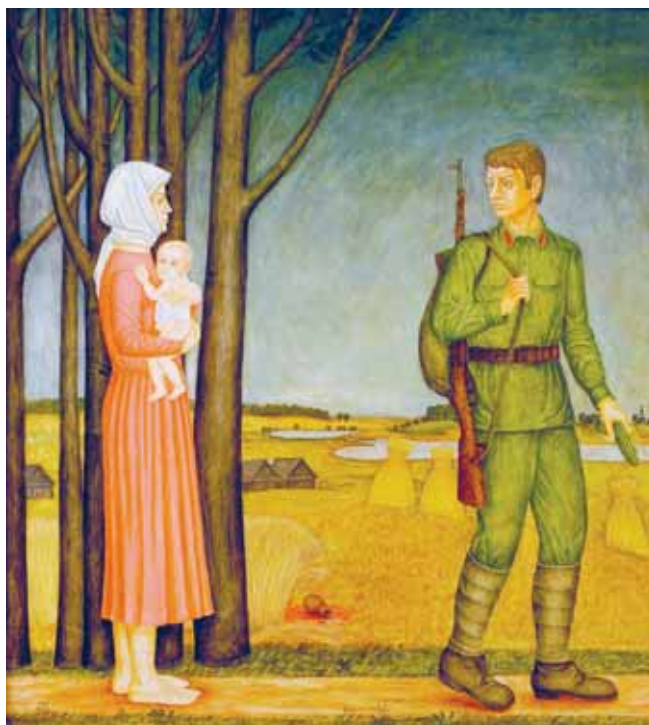
Прощание. 1978. Дерево, левкас, темпера