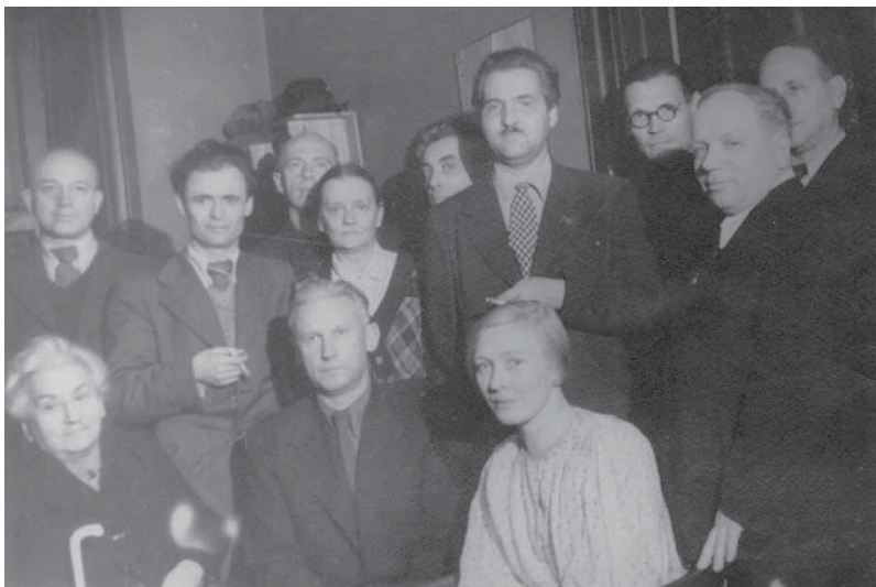
О.Берггольц с А.Фадеевым, К.Симоновым, А.Прокофьевым и другими писателями в 1946 году

Но даже тем, кто всё хотел бы сладить в зеркальной, робкой памяти людей,