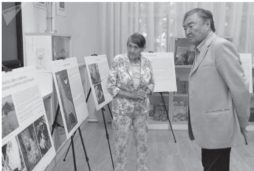
На вечере памяти Ю. Домбровского