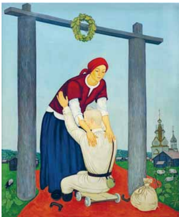
А ноги мои будут! 2015. Дерево, левкас, темпера