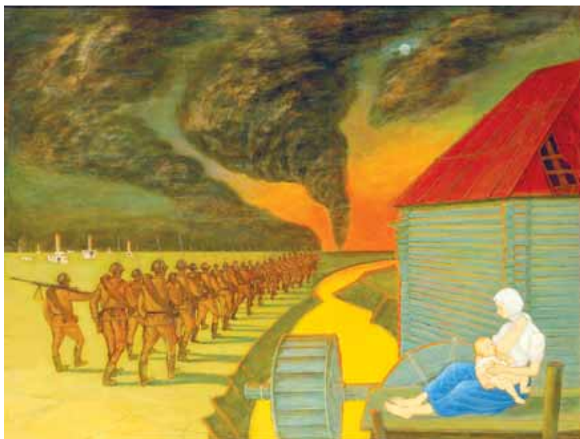
Русская мадонна. 2010. Дерево, левкас, темпера